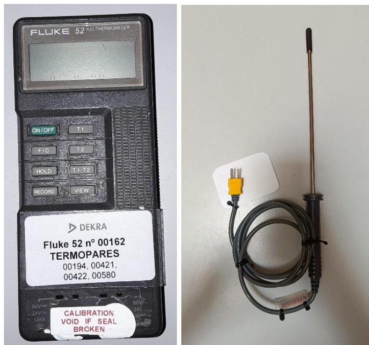
Imagen 1. Patrón Viajero y del sensor termopar tipo K.