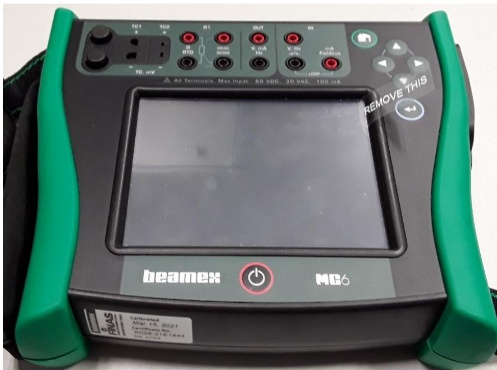
Imagen 1. Fotografía del patrón viajero.

Marca: BEAMEX Modelo: MC6 Valor económico aproximado: 10.000,00 €