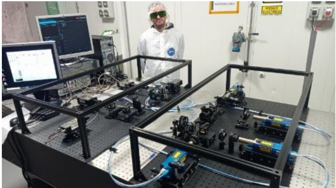
Figura 1. Versión de un laboratorio de los desarrollos del Instituto Nacional de Técnica Aeroespacial para la misión Q-ANSER

26' may. '26.- MADQuantum-CM llega a su cierre consolidando a la Comunidad de Madrid como un referente nacional e internacional en tecnologías cuánticas. El proyecto ha combinado investigación en criptografía, comunicaciones y procesado cuántico con acciones de transferencia de conocimiento y apoyo al emprendimiento.